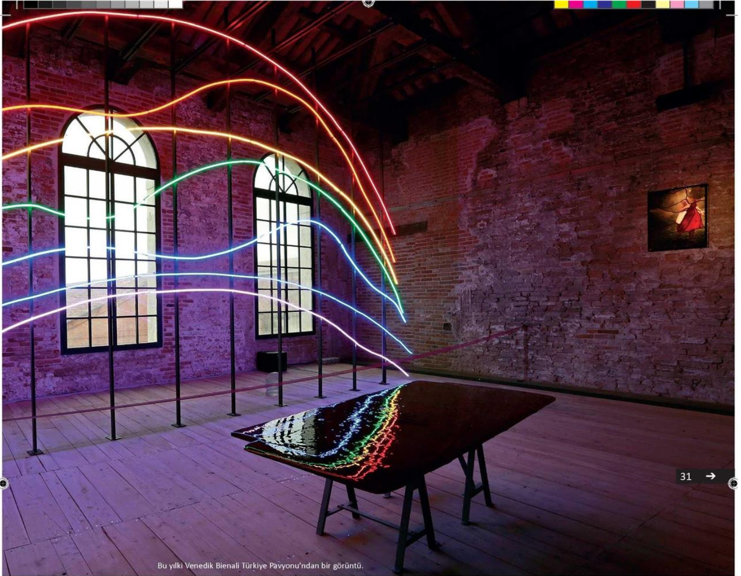
Bu yılki Venedik Bienali Türkiye Pavyonu'ndan bir görüntü.